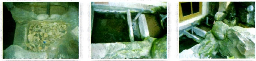
Gambar 2. kondisi bak filter pada masing-masing kolam percobaan yang berbeda

masing-masing kolam tampak ditumbuhi lumut namun lumut tersebut tetap dibiarkan dengan maksud sebagai pakan alami bagi nila dan tombro. Semua ikan dalam keadaan sehat dan menunjukkan pertumbuhan yang optimum. Bobot ikan pasca pengamatan selama 3 bulan berkisar antara \pm 600-680 g/ekor. Ikan-ikan tersebut terus dipelihara sebagai bakal induk. Dengan demikian terjadi kenaikan bobot \pm 180-