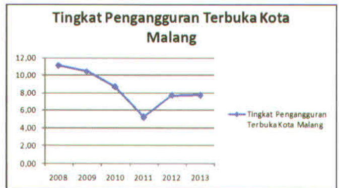
Gambar 2. Grafik Tingkat Pengangguran Kota Malang 2008 - 2013

Tabel 2. selanjutnya disajikan dalam bentuk grafik, sebagaimana Gambar 2.