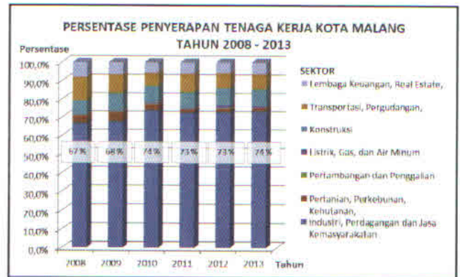
Gambar 7. Prosentase Penyerapan Tenaga Kerja di Kota Malang Tahun 2008-2013

turun sedikit menjadi 68,97% dan naik lagi 71,31% pada tahun 2013.