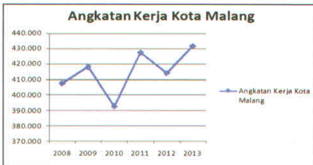
Gambar 1. Jumlah Angkatan Kerja Kota Malang Tahun 2008 - 2013

Untuk mempermudah pemahaman Tabel 1. disajikan dalam bentuk Grafik sebagai berikut: