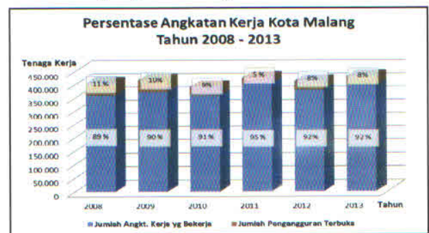
Gambar 4. Prosentase Angkatan Kerja Kota Malang 2008-2013

Angkatan kerja ('labor force') adalah bagian dari jumlah penduduk yang mempunyai pekerjaan atau yang sedang mencari kesempatan untuk melakukan pekerjaan yang produktif. meliputi penduduk berusia lebih dari 15 tahun atau kurang dari 64 tahun. Prosentase Angkatan Kerja di Kota Malang dapat dilihat pada Gambar 4.