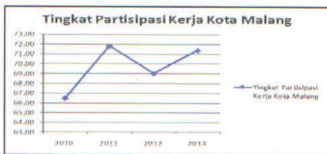
Gambar 6. Tingkat Partisipasi Angkatan Kerja Kota Malang 2008-2013

Untuk memudahkan pemahaman Tabel 5. selanjutnya disajikan dalam bentuk grafik, sebagaimana dibawah.